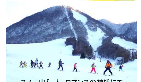
スノーリゾート ロマンズの神様に

申込開始日 2月6日(火) 10時～18時 あそびむし探検隊会員(年中・年長) 2月7日(水) 10時～18時 ワンパククラブ会員(小学1年生～中学3年生)